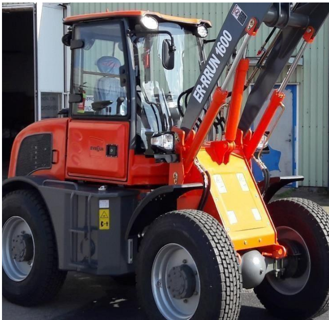
Stora däcken 22,5" Saipade lastbilsdäck