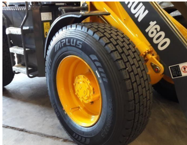
Saipade lastbilsdaäck 22,5"

Hög & Lågväxel samt 3 -4 funktion Backkamera mugghållare etc