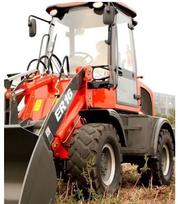
Standarddäck ; 23,5/70-16